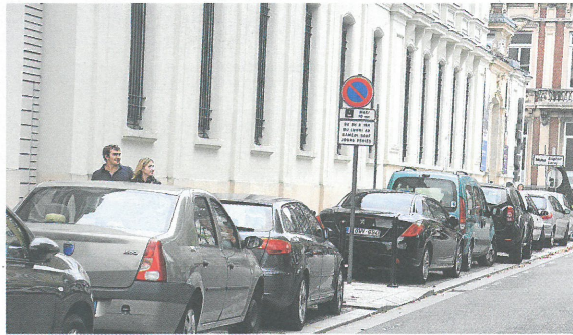
La ville de Tourcoing est en train de repenser son plan de circulation et de stationnement pour redonner de la place à la voiture en centre-ville.

Et si le dynamisme d'un centre-ville tenait à la présence de ses automobilistes ? Plusieurs villes ont fait ce pari en prenant des mesures pour favoriser leur retour.