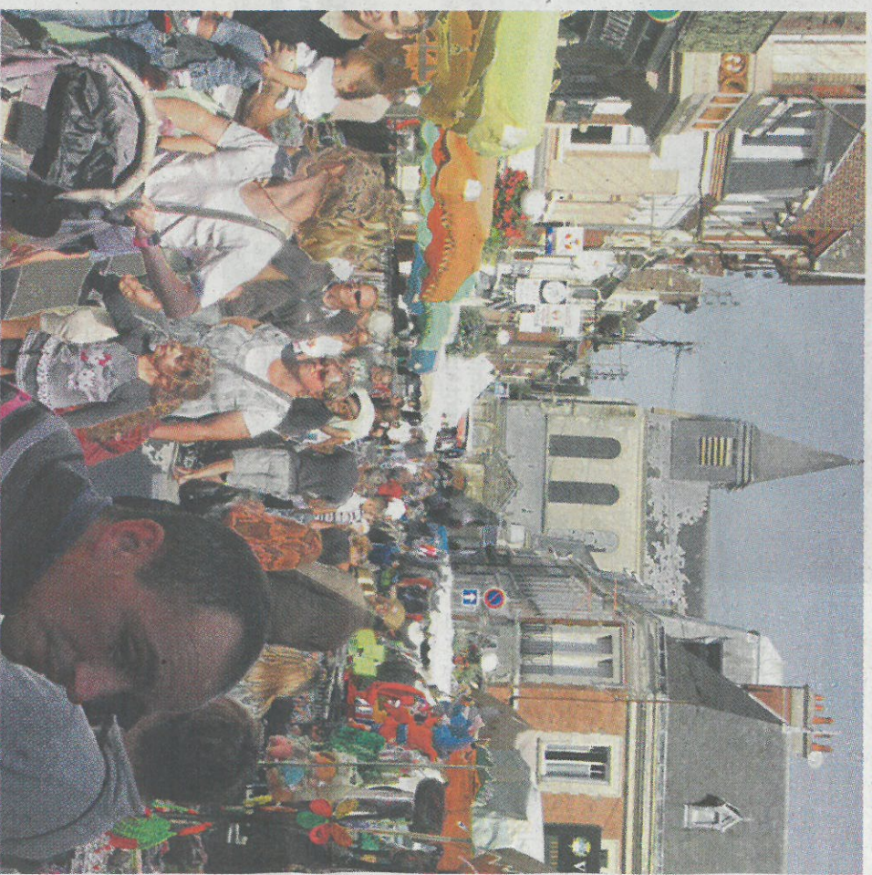
Moins en Hamois, une tendance depuis plus de dix ans. Une évolution constatée dans de nombreuses villes de l'Est de la Somme.

S 064, la baisse du nombre d'habitants dans la ville de Ham se poursuit. Déjà, entre 1999 et 2009, la chute avait été forte (la population municipale comptait 5400 habitants à la fin du siècle dernier). Selon les spécialistes de l'INSEE (Institut national de la statistique et des études économiques), la principale raison de ce mouvement est professionnelle : « Ham est une ville à forte tradition industrielle, un secteur fortement impacté par la crise actuelle. La population part trouver du travail ailleurs. »