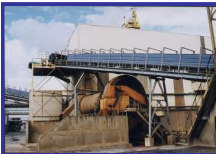
TRANSPORTEUR SÉRIE LOURDE LARGEUR 1600MM - LONGUEUR 78M :