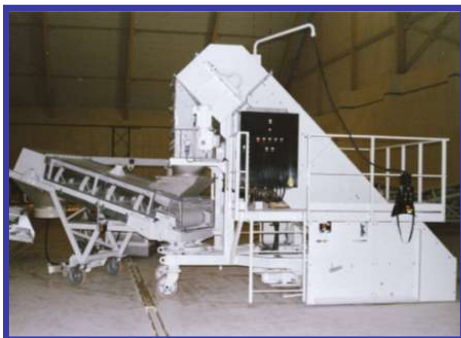
PELLETEUR VERSION SABLÉ PEINT