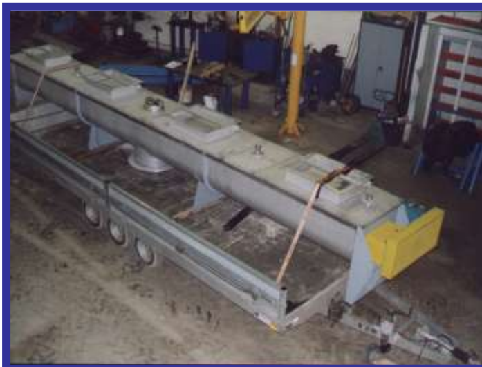
Vis Ø 500mm :