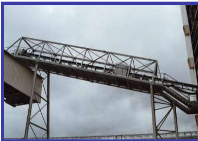
TRANSPORTEUR EN GALERIE :