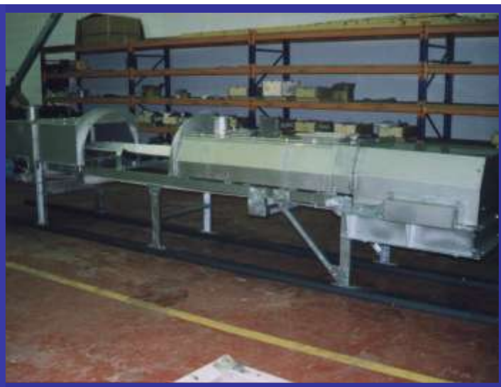
TRANSPORTEUR À CAISSONS: