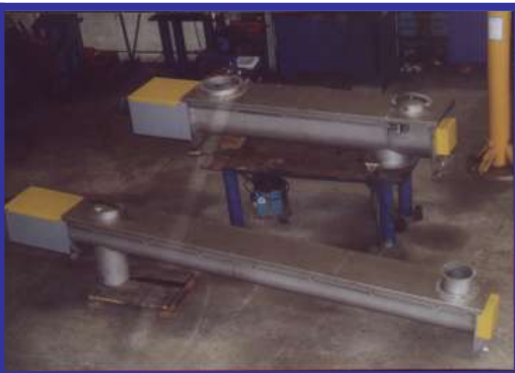
ENSEMBLE VIS :