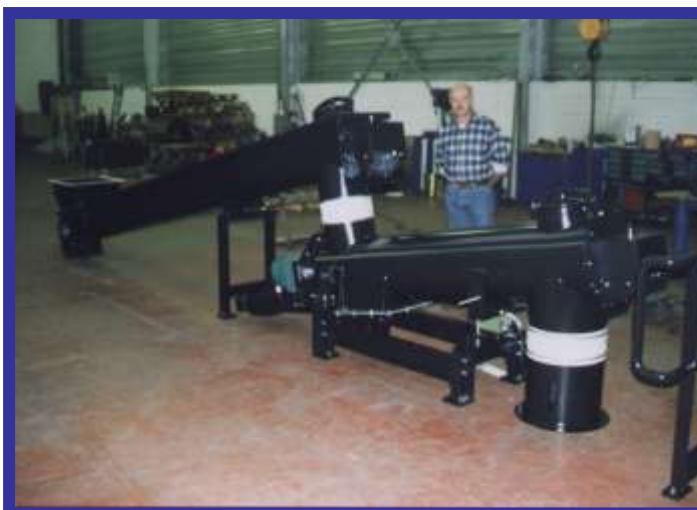
ENSEMBLE Vis Ø 315mm :